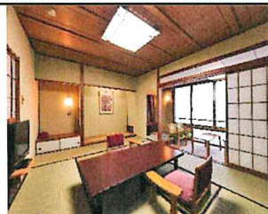
客室風景(イメージ)