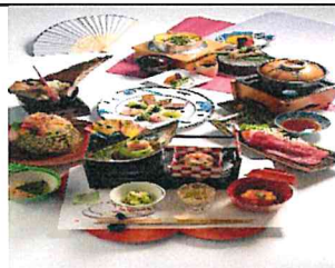
夕食料理写真(イメージ)